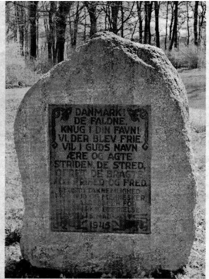
Sådan ser mindestenen i Lystanlægget ud.